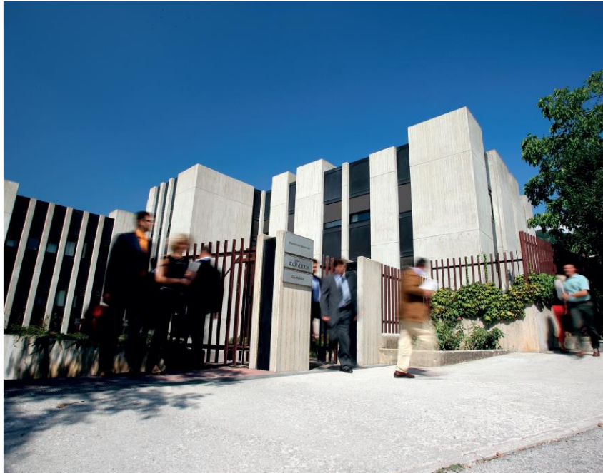
Figura 1 - Direzione Generale Colacem S.p.A. - Gubbio (PG)

Proprietario dell'EPD: Colacem S.p.A., Via Della Vittorina n. 60 – 06024 Gubbio (PG)