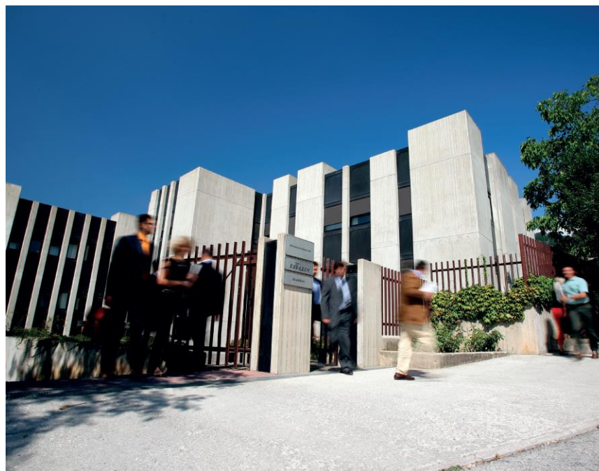
Figura 1 - Direzione Generale Colacem S.p.A. - Gubbio (PG)

Descrizione dell'organizzazione: Colacem S.p.A è una realtà industriale attiva nella produzione di cemento. L'azienda, creata dalla famiglia Colaiacovo nel 1966, si è sviluppata sullo slancio di una cultura d'impresa moderna e innovativa, fino ad attestarsi oggi in Italia, a terzo produttore 1 . La visione aziendale, improntata sulla sostenibilità, si fonda su un know-how organizzativo e tecnologico di rilievo. Colacem è certificata ISO 9001:2015. Colacem opera seguendo valori che pongono al centro la persona; per questo, lo sviluppo economico e le attività produttive vengono portate avanti di pari passo con il rispetto dell'ambiente e di chi vive nei territori, grazie a una corretta gestione delle risorse naturali, alla mitigazione degli impatti e ad un rapporto con le comunità locali attivo e responsabile. La società è presente in modo ramificato in Italia con vari stabilimenti a ciclo completo, terminal, depositi e uffici di area. La Direzione Generale è a Gubbio (PG). Gli impianti di Tunisi, Sabana Grande de Palenque (Repubblica Dominicana), Lafito (Haiti), Balldre (Albania), insieme ai terminal di Alicante, Cartagena (Spagna) e Kingston (Giamaica) rappresentano la realtà internazionale del Gruppo. In Italia Colacem occupa circa 900 dipendenti.